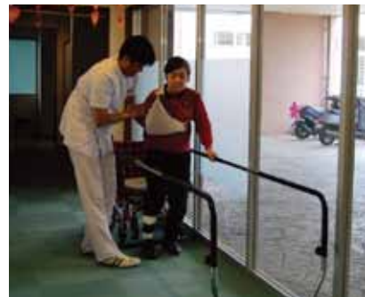
デイサービスセンターいなもと 常駐の理学療法士が個別にプログラムを作成し、日常生活に必要な体の機能の回復・維持、体力づくりをサポートします。