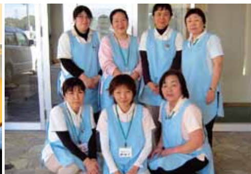
ヘルパーステーションいなもと