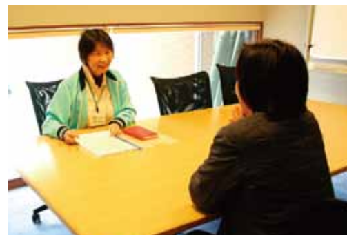
ケアプランセンターいなもと