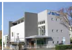
城西ヶ丘眼科 診療科目：眼科

同じ敷地内に内科クリニックと眼科が併設されています。協力医療機関では、健康相談・管理および定期回診、往診、身体急変時の助言・援助・措置を行います。また、定期健康診断を実施します。